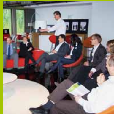
Jury-Sitzung bei Solon SE 2010

Beim INDUKOM Triple A 2011 können Sie Eigenwerbungsmaßnahmen in sieben Einzelkategorien und der übergeordneten Kategorie »Integrierte Kommunikation« einreichen.