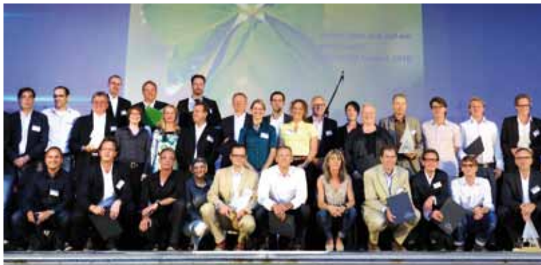
Preisverleihung Veranstaltungsforum Fürstenfeldbruck 2010