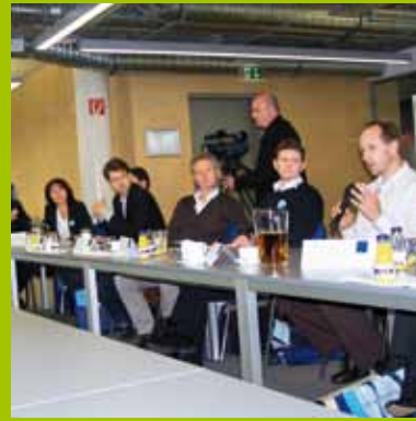
Jury-Sitzung bei Solon SE 2010